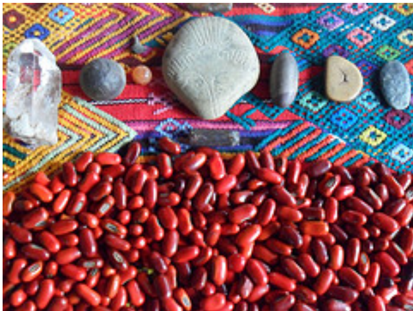
Saq' Be' Organisation