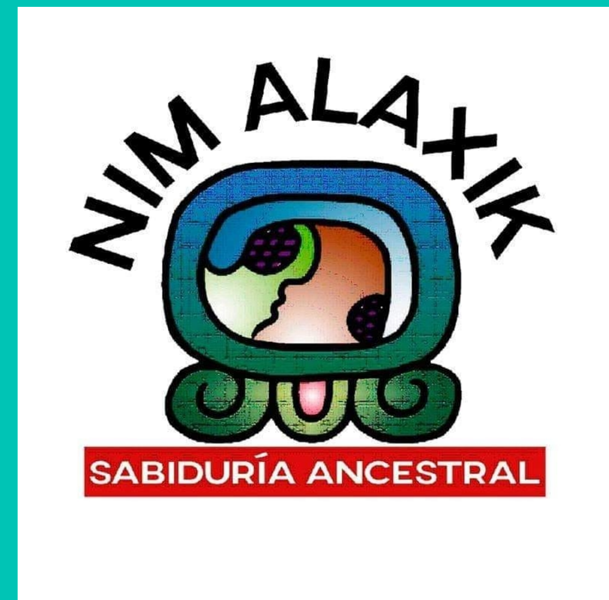
National Movement of Midwives Nim Alaxik Logo in Facebook