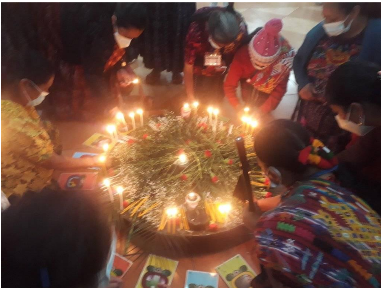
National Movement of Midwives Nim Alaxik Facebook 08-10-2021