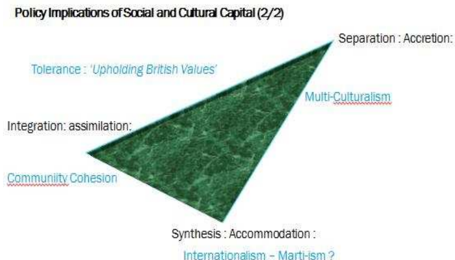
Figura 2. Nuevo modelo

América del Sur en particular Cuba, sugirió que cada generación se inventa para adaptarse a los nuevos retos que se enfrentan. La teoría post-moderna (eg Barthes,) hace hincapié en el papel del capital cultural y social en el enriquecimiento de las oportunidades. El primero está relacionado con tener un sentido de los valores culturales y la comprensión sobre el mundo, mientras que el segundo se refiere a las redes de contactos que uno puede recurrir para el adelanto.