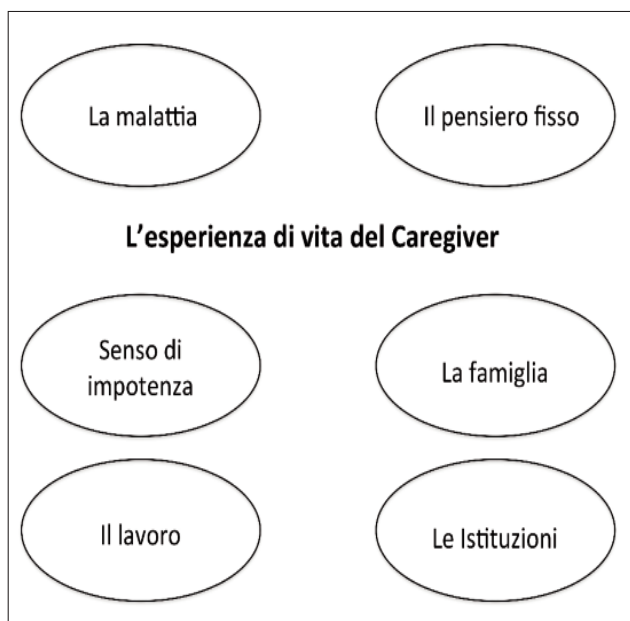
Fig.1 Le sei sfere dei temi estratti

connessione tra loro sono stati mantenuti come temi singoli data l'importanza che ricoprono nell'esperienza del caregiver.